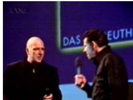
Filmfest-Moderator mit Gast