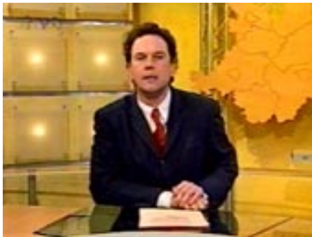
Moderator TV Oberfranken