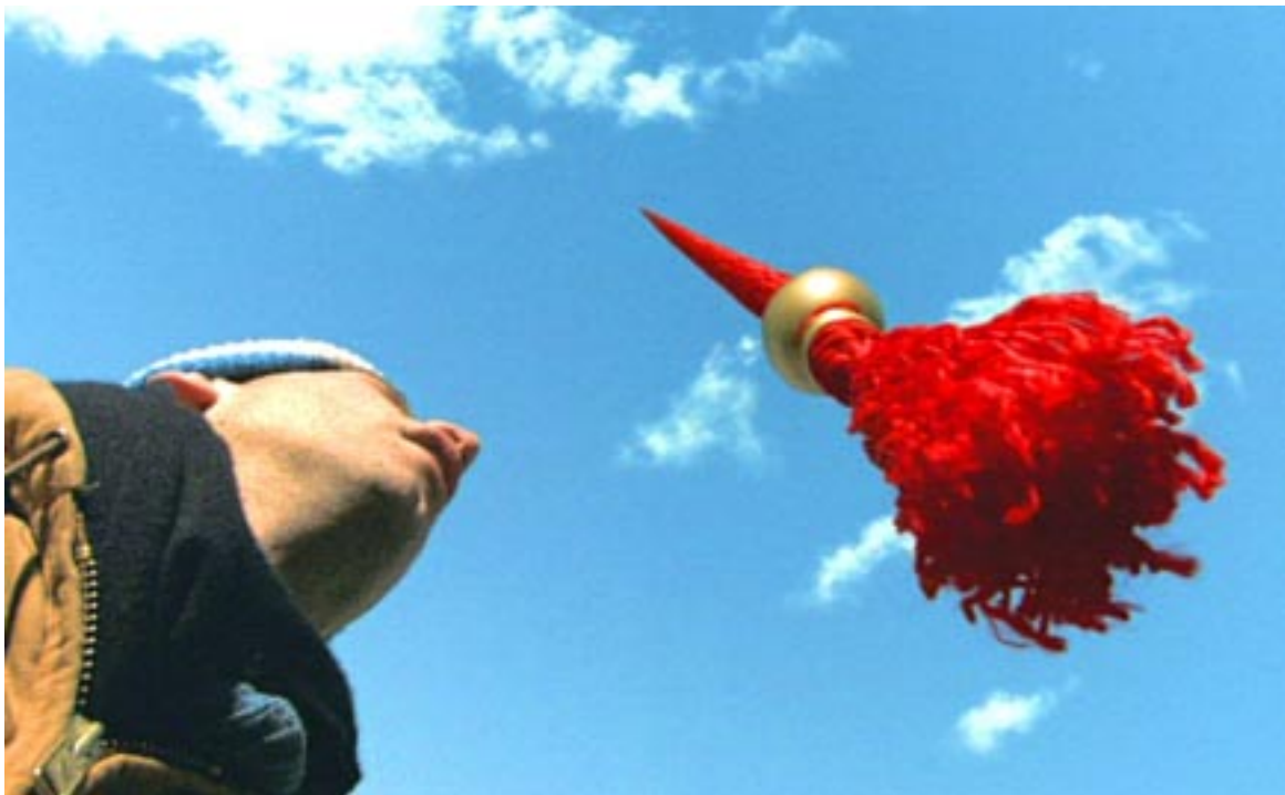
Szenenfoto aus „Dangle“, einem der Beiträge beim Kurzfilmfest.

Vom 6. bis 8. Februar findet zum fünften Mal das Bayreuther Kurzfilmfest „Kontrast“ statt. In sieben Filmblöcken bewerben sich mehr als 50 Kurzfilme aus dem In- und Ausland um den Sparkassenfilmpreis und den Sonderpreis zum Thema „Daneben“. Im Anschluss an die Preisverleihung startet die Filmfestparty. Nach dem „Frühstück für alle“ am Sonntagmorgen stehen Kinderfilme, eine Auswahl der besten Filme vom weltberühmten Animationsfilmfest der Bayreuther Partnerstadt Annecy und ein Block mit den Besten von „kontrast 2004“ auf dem Programm. Als besonderes Highlight präsentiert Turid Martinsen, Leiter der Norwegischen Filmschule „Medifabrikken i Akershus“, im Programm „Nordic Visions“ eine Auswahl neuer skandinavischer Kurzfilme. Herbert Heinzelmann vom Institut für Kino und Filmkultur gibt in seinem Seminar „Daneben, Dazwischen, Dagegen: Die Engel im Film“ Auskunft über Sinn und Funktion dieser übersinnlichen Gestalten. (Informationen unter www.kontrast-filmfest.de .)